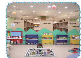
문막 장난감도서관 놀이체험실