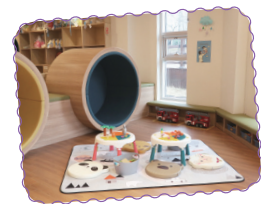
보물섬 장난감도서관 놀이체험실